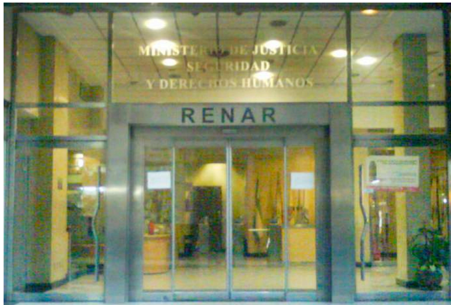
HALL DE ACCESO AL NUEVO EDIFICIO DE LA SEDE CENTRAL DEL RENAR SITA EN BME. MITRE 1469 CAPITAL, ADQUIRIDA CON FONDOS PROPIOS DERIVADOS DE LA APLICACION DE LA LEY 23.979.

El material de resistencia balística satisface los requerimientos de la Norma MA.02, cuando la probeta de ensayo iguala o supera las especificaciones de la tabla N°1.